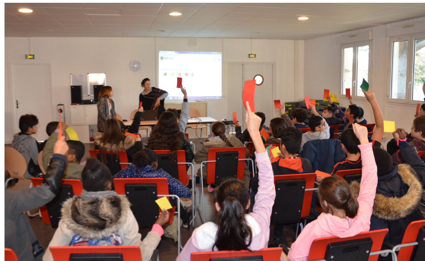
➤ Des élèves du collège Robespierre testent ensemble leur baromètre qui leur fera découvrir leur arbre de la confiance.